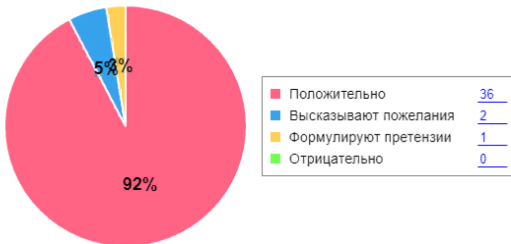
Как родители оценивают детский сад

Анкетирование родителей показало высокую степень удовлетворенности качеством предоставляемых услуг.